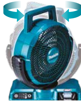
Trái / Phải 45°