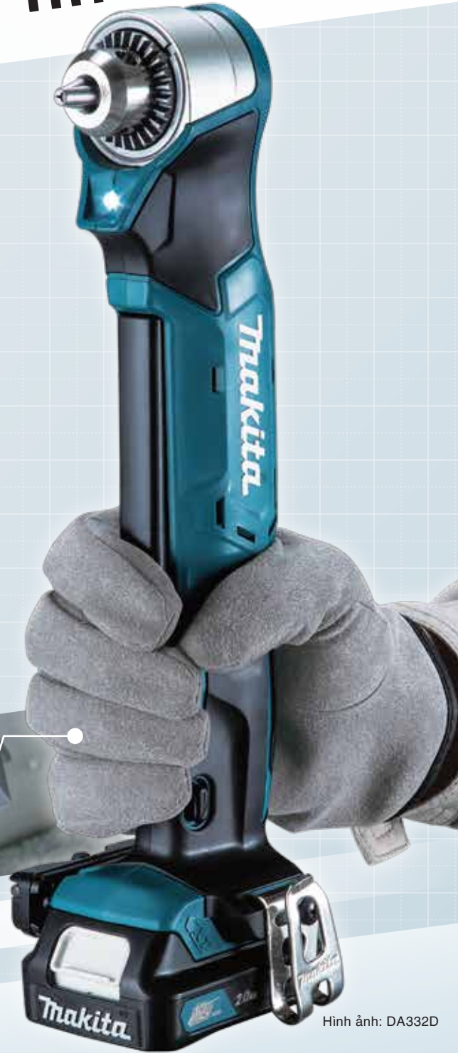
Hình ảnh: DA332D

Tay cầm thiết kế công thái học chắc chắn