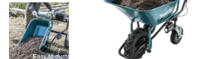
Easy to dump