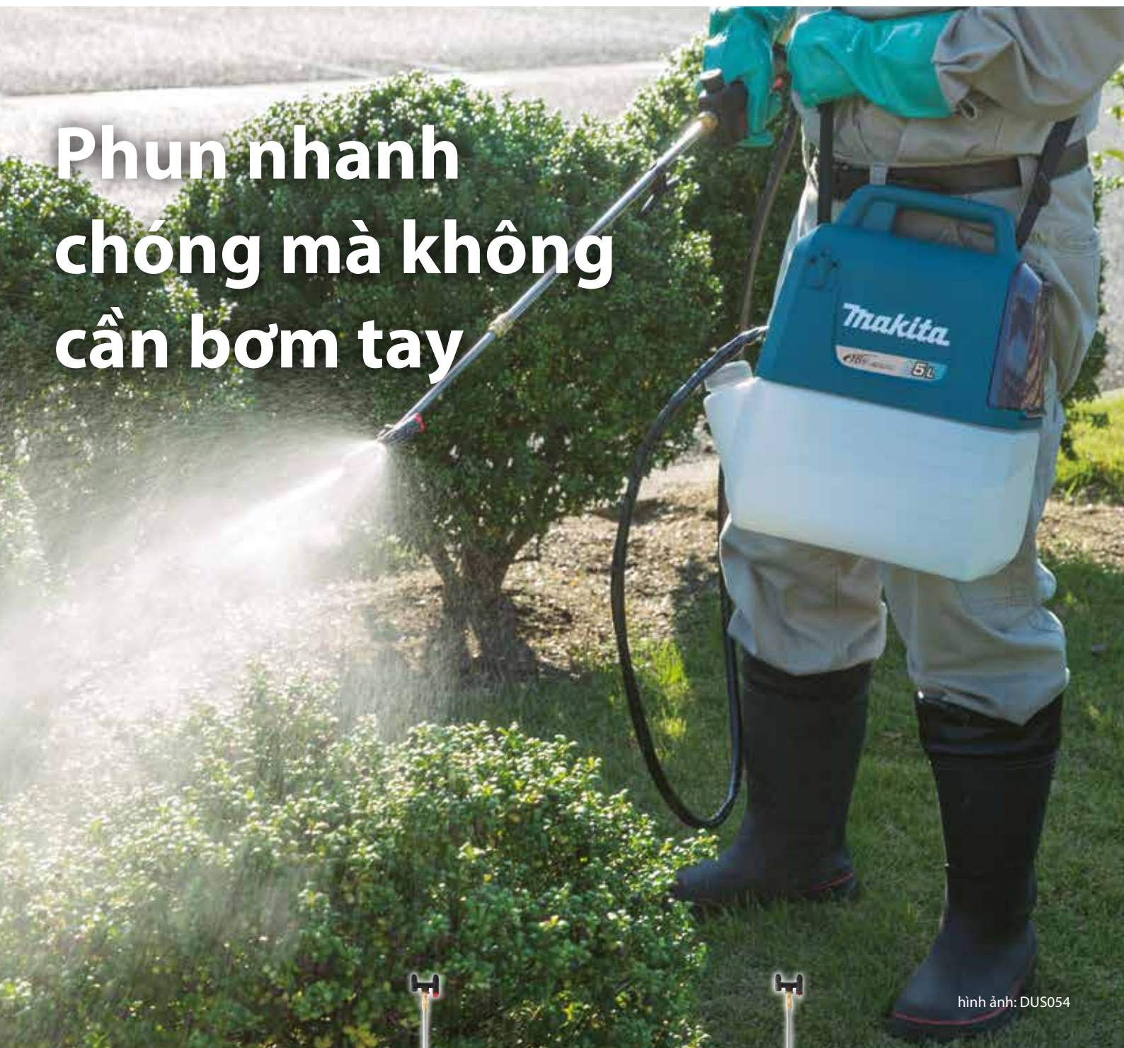
hình ảnh: DUS054