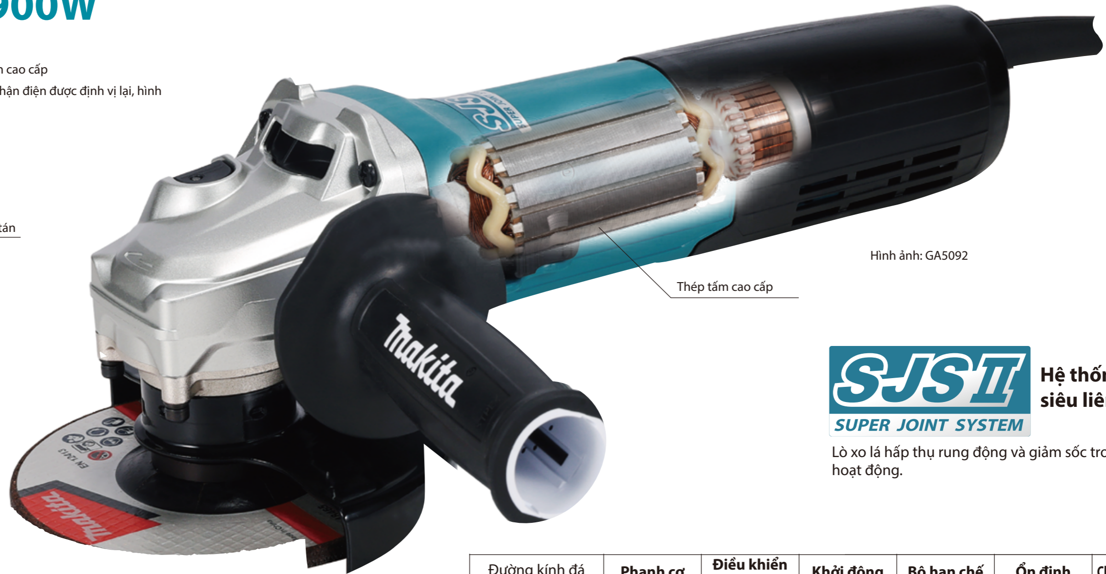
Thép tấm cao cấp