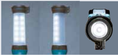
full half Top LED