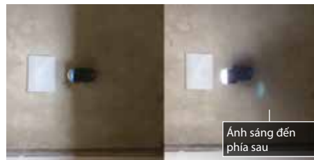
không có chụp chống chói