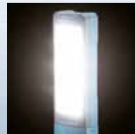
Thấu kính khuếch tán ánh sáng