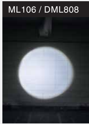
Toàn bộ vòng tròn chiếu sáng đồng đều