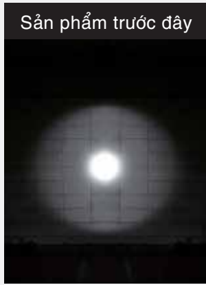
Chỉ sáng vùng trung tâm