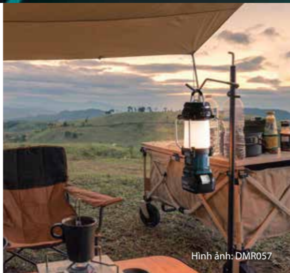
Hình ảnh: DMR057