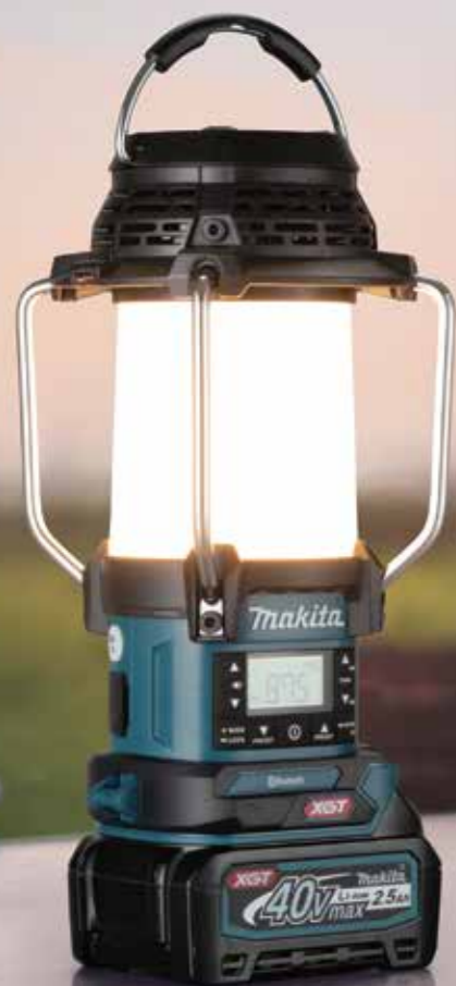
Hình ảnh: MR010G