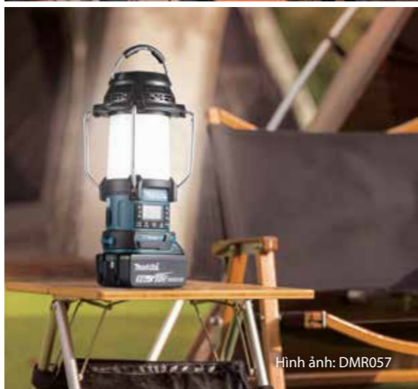
Hình ảnh: DMR057