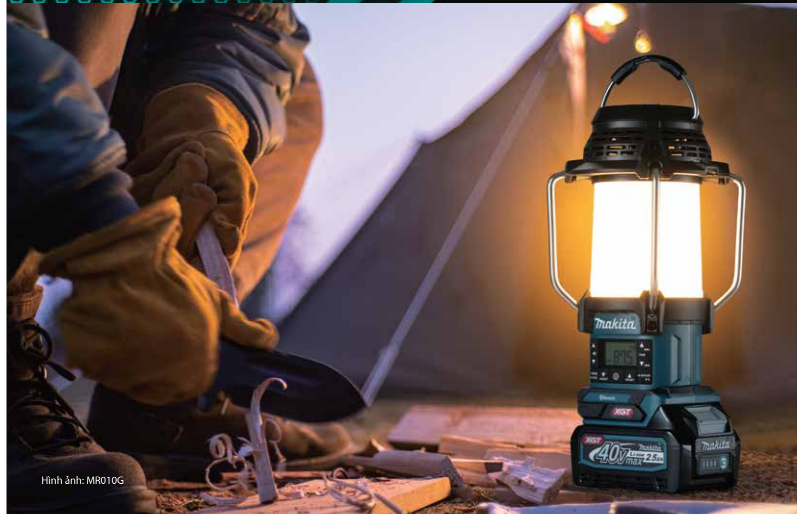
Hình ảnh: MR010G

TRUNG TÂM DỊCH VỤ KHÁCH HÀNG CHỊ NHANH HÀ NỘI Số 12 Trịnh Văn Cấn, P. Cầu Ông Lãnh, Q. 1, TP. Hồ Chí Minh,ĐT: 0283 821 5191