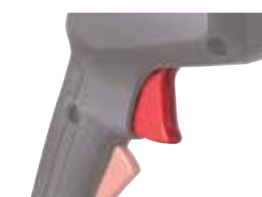
Thay đổi tốc độ bằng cò