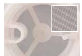
Đường kính bộ lọc bình chứa: 0.5mm (lớn nhất)