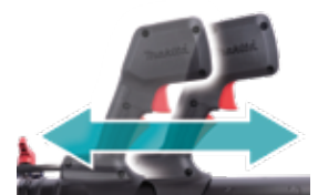
Cần điều khiển linh hoạt