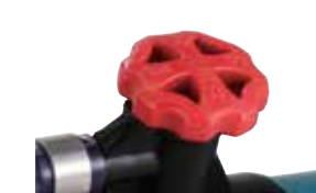
Nút điều chỉnh lượng phun