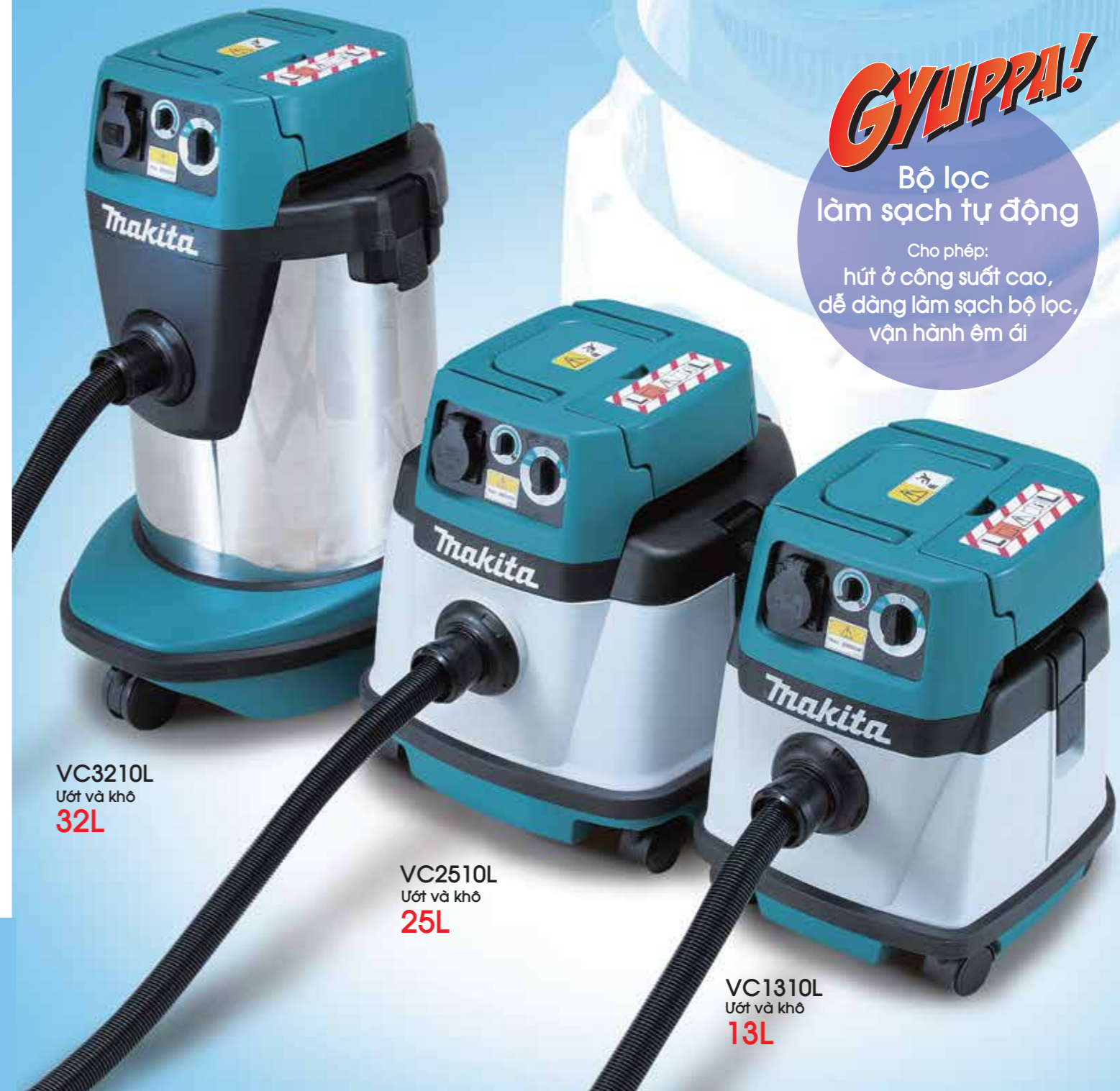
VC3210L Ướt và khô 32L

Cho phép: hút ở công suất cao, dễ dàng làm sạch bộ lọc, vận hành êm ái