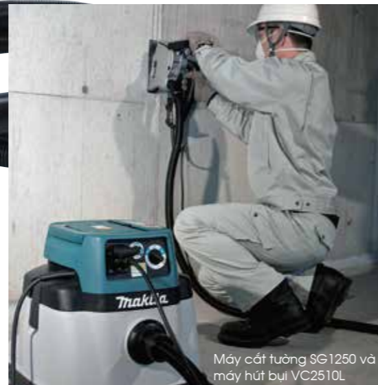
Máy cạo tường SG1250 và máy hút bụi VC2510L