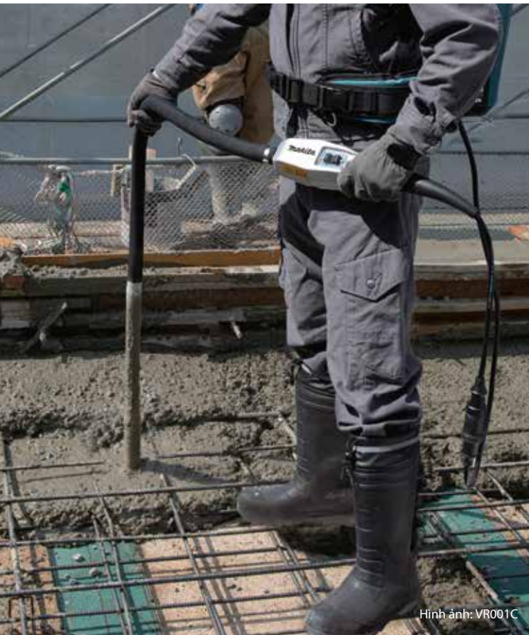
Hình ảnh: VR001C

Máy có đường kính lớn cho phép đầm trên diện rộng.